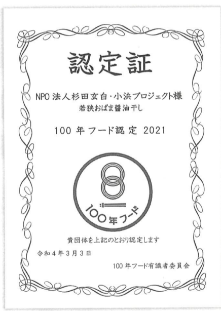
100年続く味として認定されました