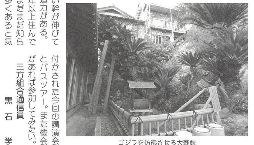
ゴジラを彷彿させる大蘇鉄

番大きな川が「はす川」と呼ばれていることから、身近な魚だったのだらう。 ちなみに、はすは琵琶湖、淀川水系(大和川水系を含む)、三方湖にしか生息していないそう。 他にも、久々子湖でよく獲れていたシジミも最近では数が激減しているそう。 また、私が子供のころ、父とハゼ釣りによく行った思い出があるが、ハゼも減っていると聞く。 きつと湖の環境が変わってきているのだらう。 寂しい報告があったが、うれしいものもあった。福井県内でコウノトリが見かけられるようになった。 樋口研究員の講演会のあと、20名ほどで常神半島までのバスツアーに参加した。地元のツアーガイドの話聞きながら半島先端の常神地区へ向かった。常神の神社、国指定の天然記念物「常神の大蘇鉄」を見学。樹齢千年以上といわれている大蘇鉄は日本海側の北限