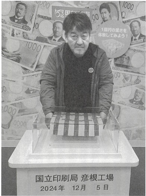
国立印刷局 彦根工場 2024年 12月 5日