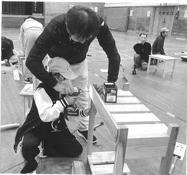
夢中で組み立てる児童