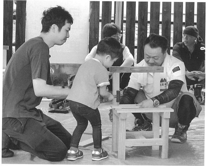
イスづくりを体験する親子

8月27日に坂井市丸岡町城のまちコミュニティセンターで行われた城のまちフェスティバルの会場で、木製イスづくり体験を行いました。 例年は午前と午後の2回計20名程度の子どもたちにも体験してもらっていたが、主催者側の意向もあり、熱中症対策として午前10時から12時までの2時間で3回、各回5名計15名程度として時間を短縮して実施しました。