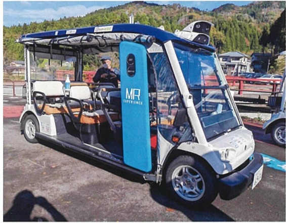
国内初の完全自動運転車両

永平寺町で2023年5月、国内初の自動運転レベル4(特定条件下に)による完全自動運転(約2.5km)の約2.5km、[荒谷]京福電鉄永平寺線の廃止区間の廃線跡を活用した町道「永平寺参(まい)ろーど」の約2.5km、[荒谷]が利用できる区間は、