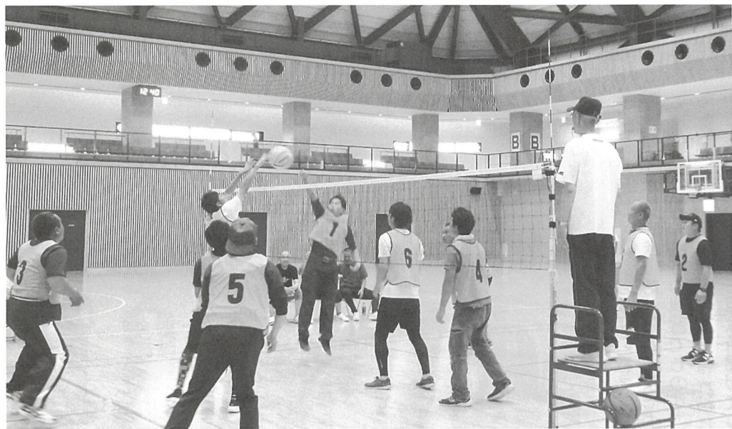
全力でプレーする嶺南ブロックの組合員