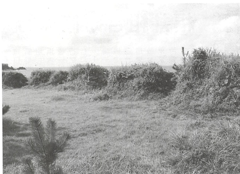
国史跡・丸岡藩砲台跡

東尋坊から浜地海水浴場に向かう途中、越前松島水族館を過ぎてすぐ左側に「丸岡藩砲台跡」の立て看板が見えてくる。駐車場から100mほど遊歩道を歩いていくと、長さ東西33m、高さ1.8m、5つの砲眼を開く石垣と土塁で造られた橋塙(きょうしょう)の敵の攻撃を避け味方の射撃の安全を確保するために胸の高さほどに積み上げた土塁や石垣が海岸線に広がっている。国の史跡に指定されている。