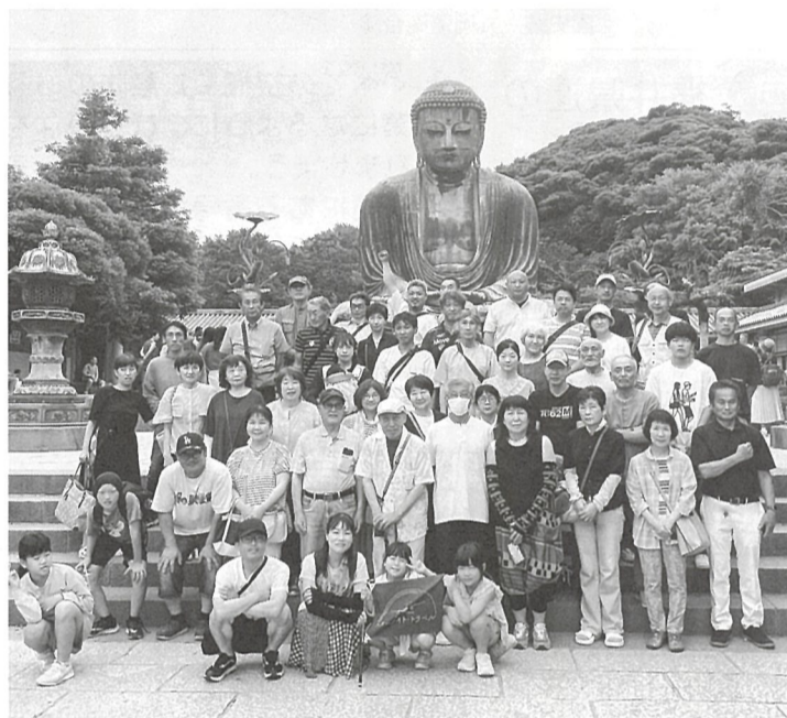
鎌倉大仏の前でパチリ！