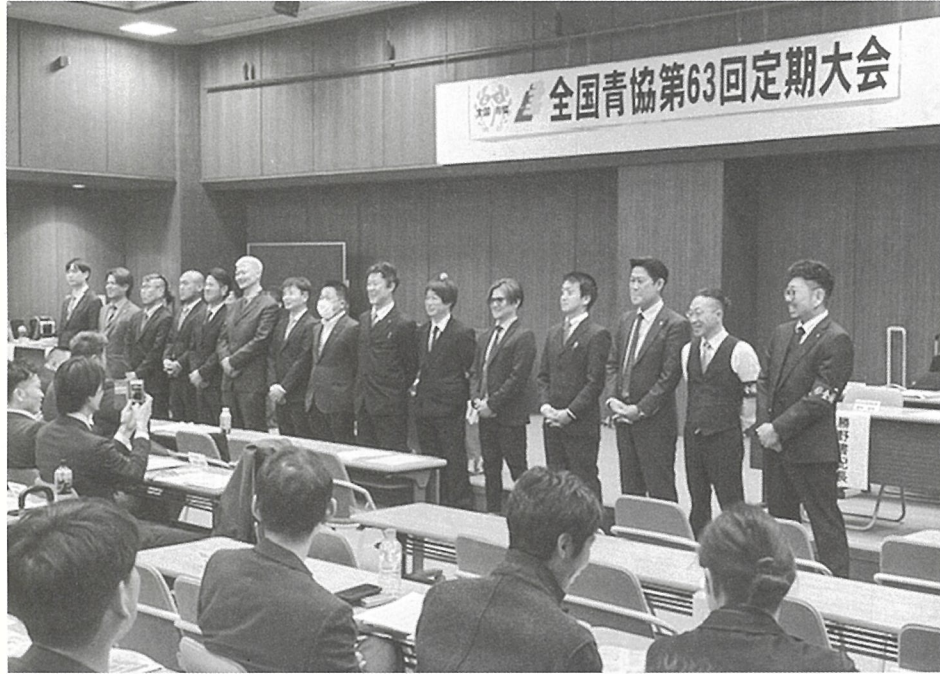
定期大会で紹介される新役員