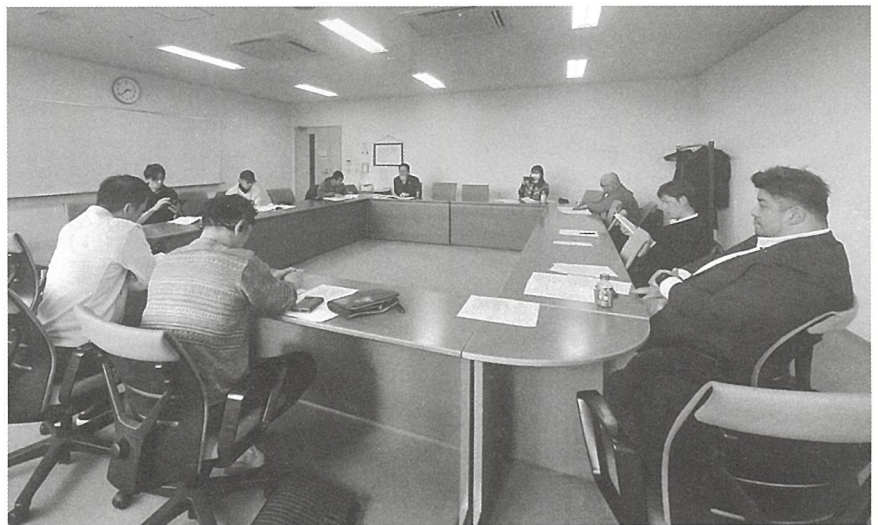
被害状況を報告する北信越5県の幹部