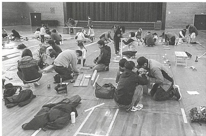
組合員と協力して工作する親子

12月3日DIY教室の 当日、インフルエンザ流 行と重なってしまい、前 日から当日にかけて体調 不良で欠席の電話が相次 ぎ、19組の親子の参加と 少し寂しい結果となって しまいました。協力して 頂いた組合員の方とマ ンツーマン指導が可能と なりまして。 前もって会場である越