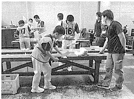
丁寧に椅子を作り上げていく選手たち

7月8日(土)、福井県立福井産業技術専門学院にて、第21回アビレンピック福井大会2023が行われました。