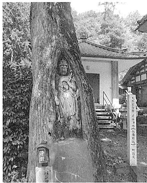
イチヨウの木に彫られた観音様

の伝統芸能の伝承芸能の会所が三国にあり、参加者が楽しくながら伝統芸能を体感することができ、事前練習会も行われているので、初心者の方でも気軽に参加できます。皆様にもぜひお越しいただきたいです。