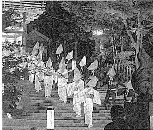
次世代に伝承していききたいまち流し

三国湊帯のまち流しは、今年で12回目を迎え、9月2日にえちぜん鉄道三国駅周辺で開催されました。19の団体参加と個人参加を合わせて、総勢350名のエントリーがありました。