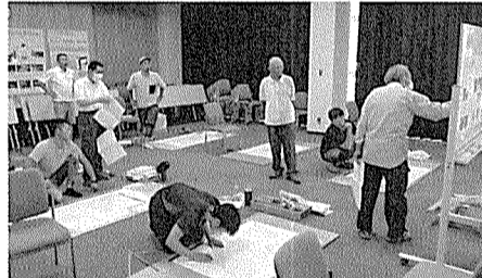
図面を正確に書く練習に励む受講者

終了。2日目は、分散教室での実技課題のまとめと発表があり、各教室を担当した講師から講評をいただいた。全体会場に戻り、参加者へ修了証授与を行い、最後に正垣教宣部長が総評をして閉校となった。解散時に事務連絡があり、かつては2泊3日で開催されていた「鬼の教宣大学の復活」を来年は目標に計画していると言われているのが楽しみでもある。今回の内容をしっかりと理解し、今後の機関紙編集に活かしていきたい。