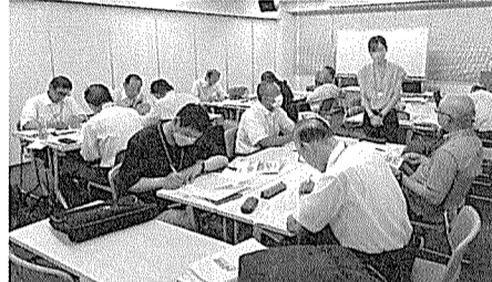
分散教室で課題に取り組む参加者

7月3日、4日の1泊2日の日程で、全建総連教宣部主催の教宣大学は、4年ぶりの対面開催となり、東京「ワイム会議室」と「全建総連会館」の2会場で行われ、全国25県連から90名が参加し、福井県建築組合連合会からは、教宣委員会を代表して私が出席した。